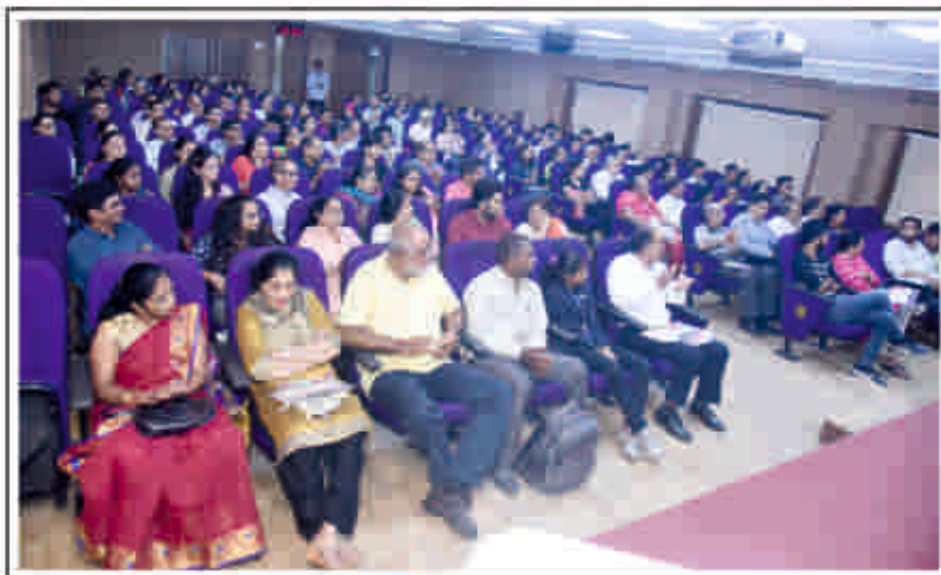
આ પ્રસંગે ઉપસ્થિત વાલીઓ તથા આમંત્રિત મહેમાનો