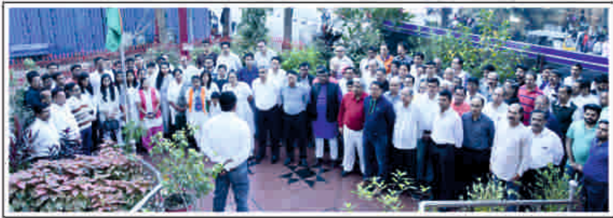
રાષ્ટ્રભાવના પ્રદર્શિત કરવા ધ્વજવંદન પ્રસંગે, કર્મચારીગણ સાથે બેંકના પ્રમુખશ્રી, ઉપપ્રમુખશ્રી, જનરલ મેનેજરશ્રી, તથા બેંકના વહીવટી અધિકારીઓ