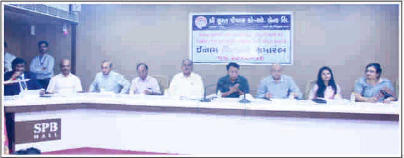
આ પ્રસંગે ઉપસ્થિત પ્રમુખશ્રી, સાથી ડિરેક્ટરશ્રીઓ તથા જનરલ મેનેજરશ્રી