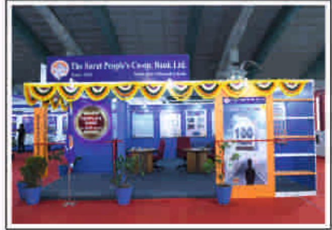
ઉધોગ ૨૦૨૦માં બેંકના નવનરમ્ય સ્ટોલની એક ઝાંખી