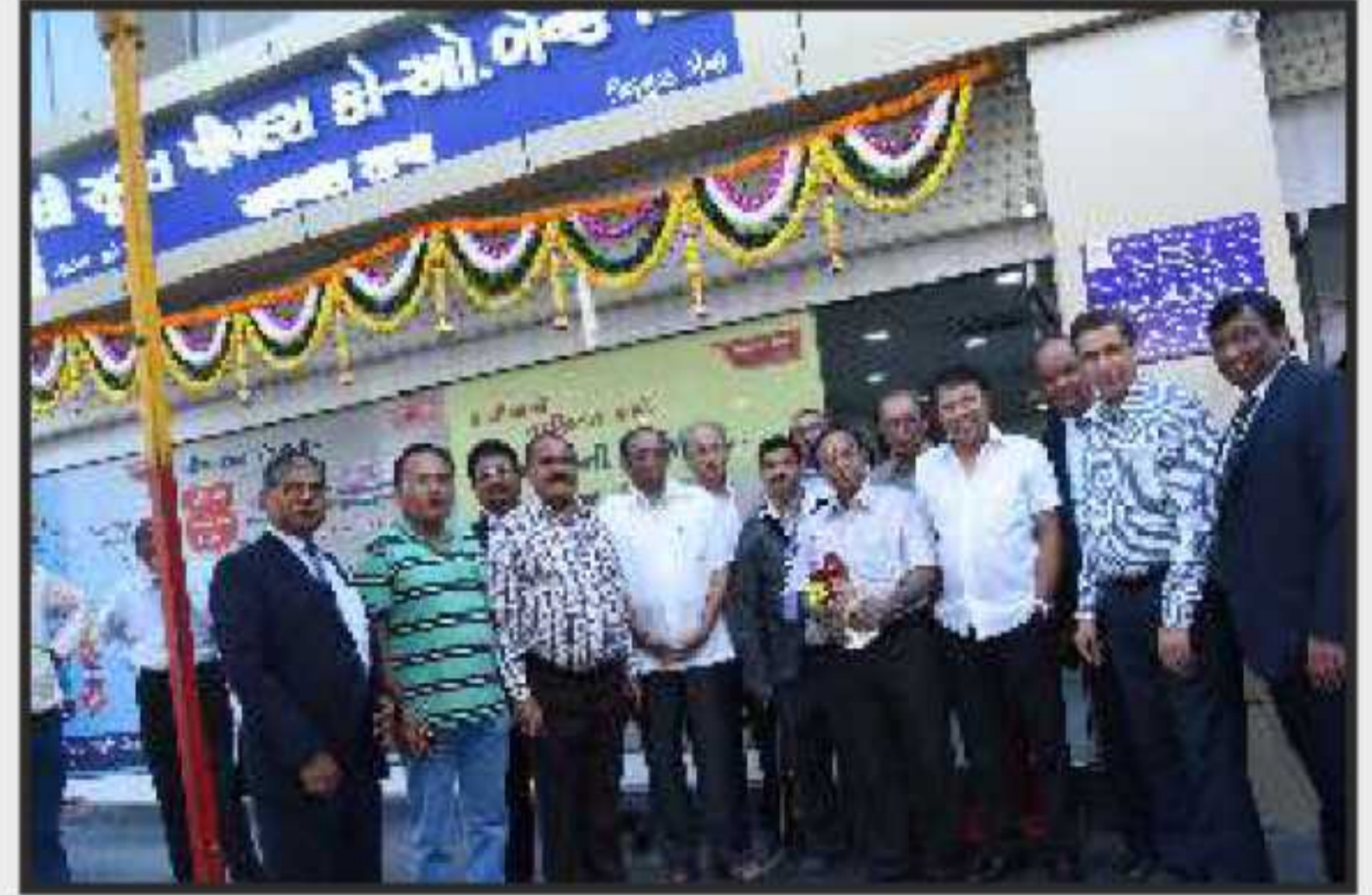
બેન્કની અલથાણ શાખાના શુભારંભ પ્રસંગે ઉપસ્થિત બેન્કના પ્રમુખશ્રી, અન્ય ડીરેક્ટરશ્રીઓ અને વહીવટી અધિકારીઓ (તા.૨૫/૧૧/૨૦૧૬)