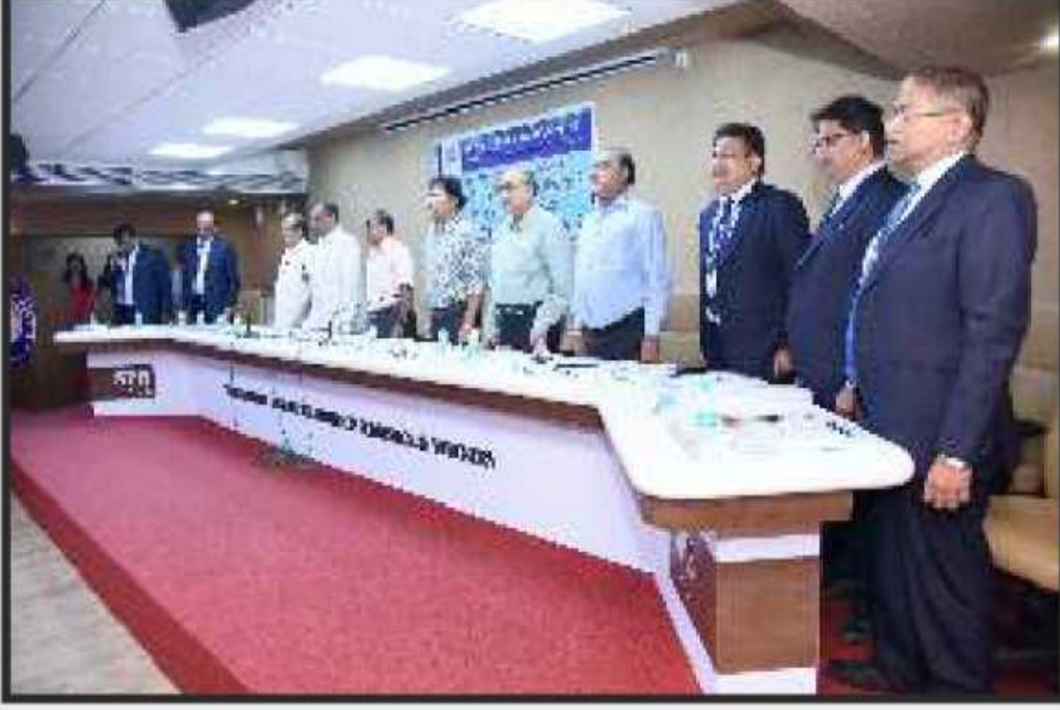
આ પ્રસંગે ઉપસ્થિત પ્રમુખશ્રી, સાથી ડિરેક્ટરશ્રીઓ અને બેન્કના ઉચ્ચ અધિકારીઓ