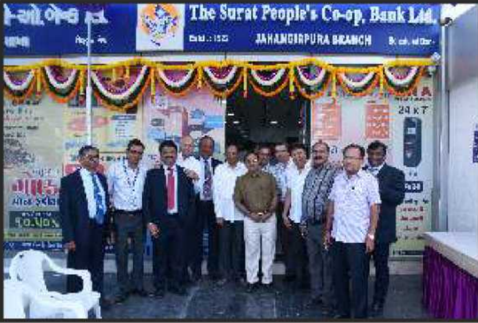
બેન્કની જહાંગીરપુરા શાખાના શુભારંભ પ્રસંગે ઉપસ્થિત બેન્કના પ્રમુખશ્રી, અન્ય ડીરેક્ટરશ્રીઓ અને વહીવટી અધિકારીઓ (તા.૨૪/૧૧/૨૦૧૬)