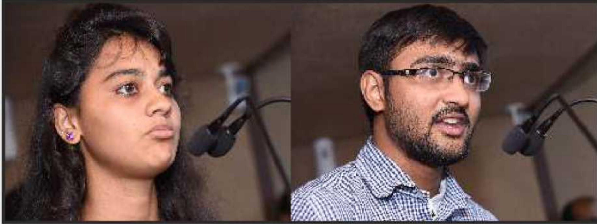
પ્રતિભાવો આપતા વિજેતાઓ