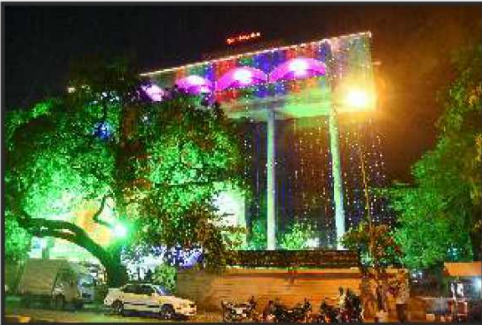
દિવાળીના પર્વે સુશોભિત બેન્કની સેન્ટ્રલ ઓફિસ 'વસુધારા ભવન' બિલ્ડીંગ