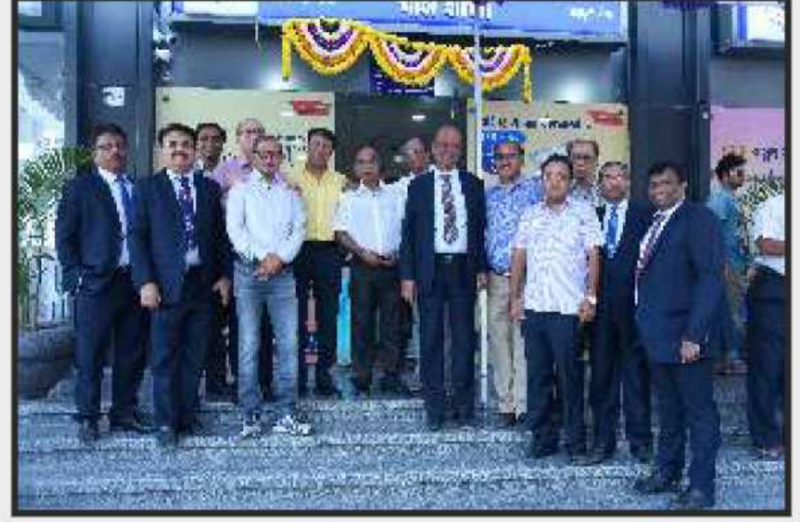
બેન્કની પાલ શાખાના શુભારંભ પ્રસંગે ઉપસ્થિત બેન્કના પ્રમુખશ્રી, અન્ય ડીરેક્ટરશ્રીઓ અને વહીવટી અધિકારીઓ (તા.૧૨/૧૧/૨૦૧૬)