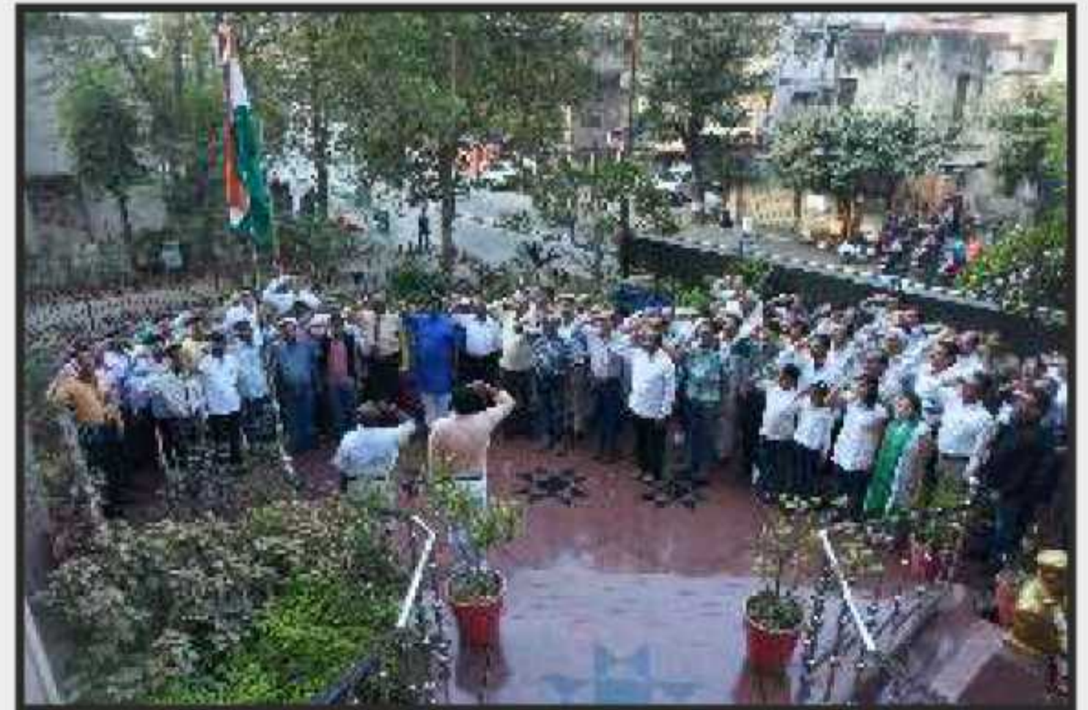
રાષ્ટ્રીય પર્વ ગણતંત્રદિને રાષ્ટ્રધ્વજને સલામી અર્પણ કરતા પીપલ્સ બેન્ક પરિવારના સભ્યો (તા.૨૬/૦૧/૨૦૧૭)