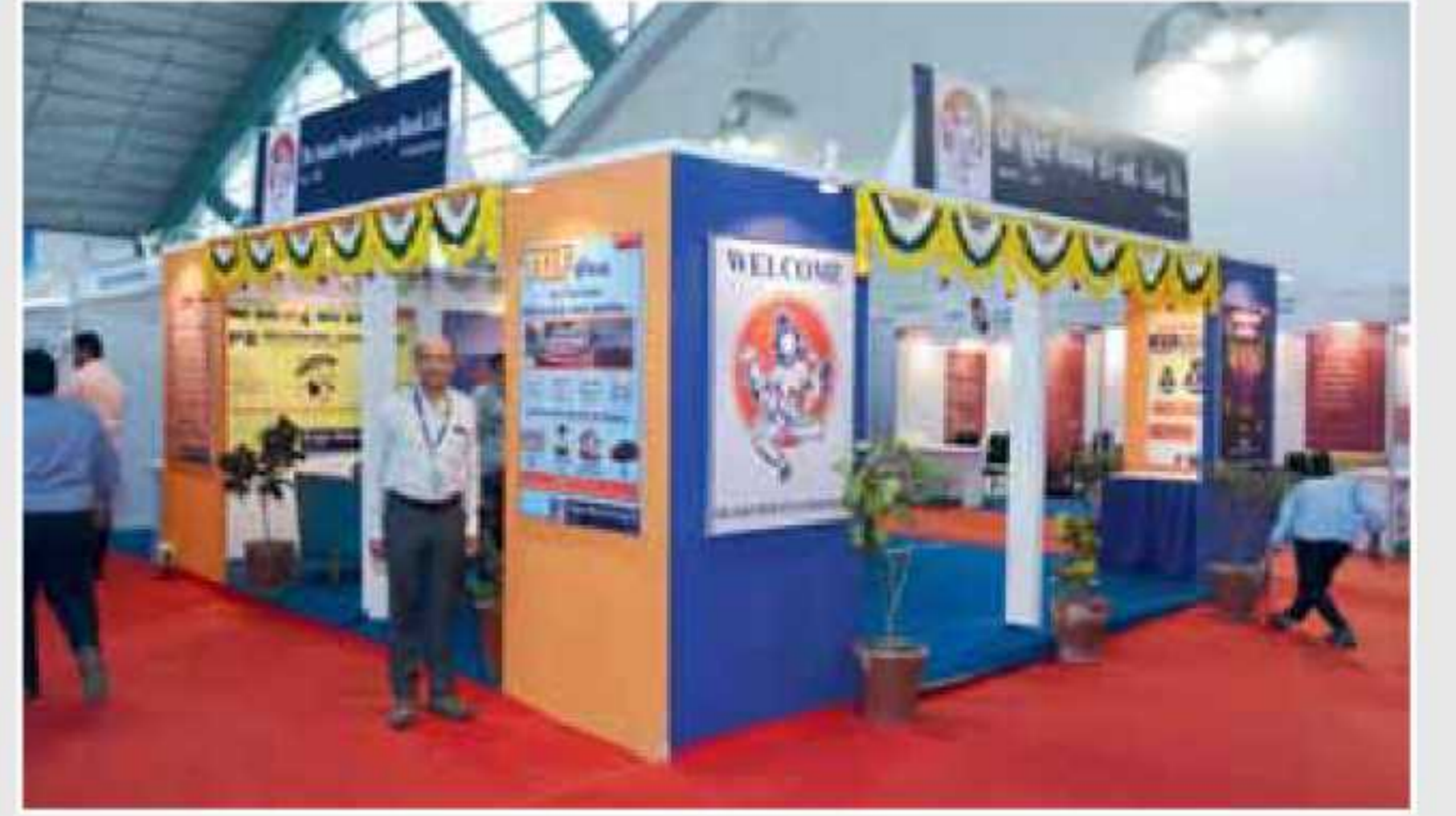
ઉદ્યોગ-૨૦૧૬માં બેન્કનો સ્ટોલ