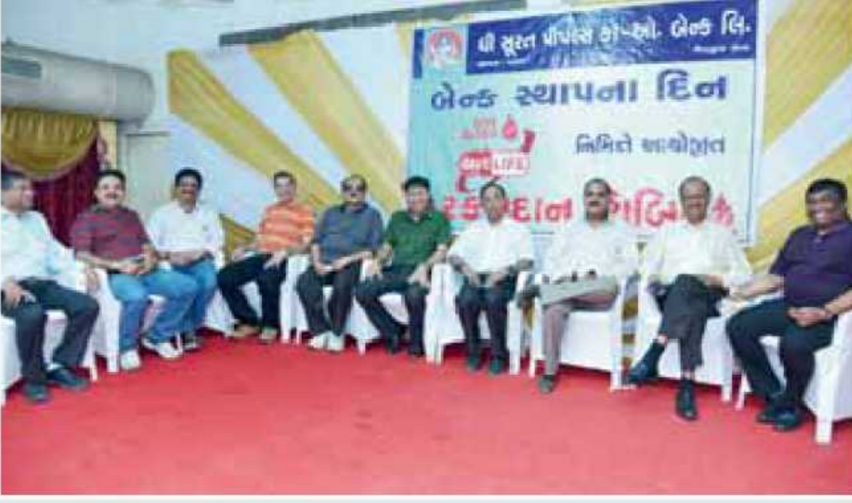
આ પ્રસંગે ઢાજર રહેલ બેન્કના બોર્ડ ઓફ ડિરેક્ટર્સ તથા વહીવટી અધિકારીઓ