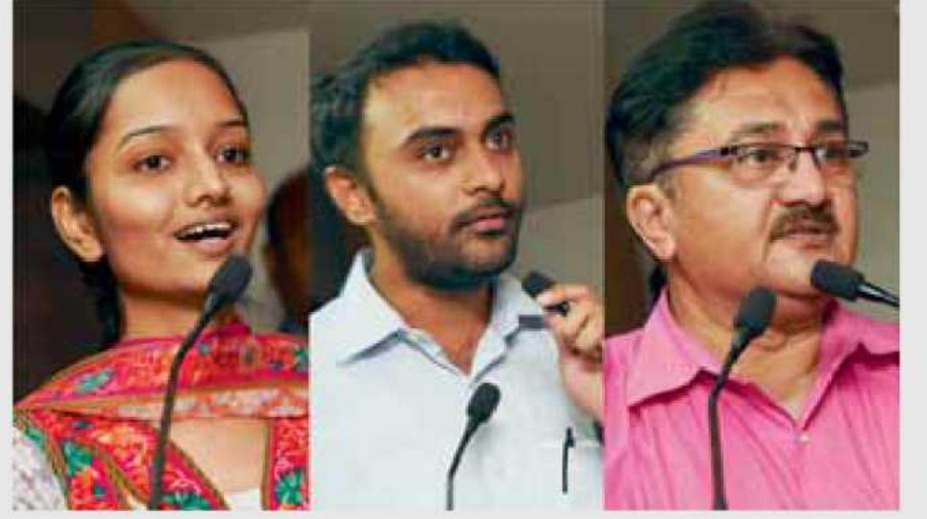
બેન્કની આ પ્રવૃત્તિને બિરદાવતા વિજેતાઓ/વાલી.